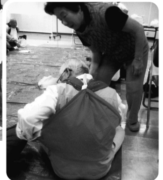
風呂敷2枚でリュック