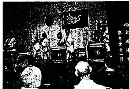
堀崎町自治会館で