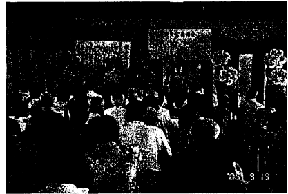
東大宮自治会館で

東大宮見沼地区自治会連絡協議会は、東大宮駅西口の七自治会で構成され、毎年各自治会が交代で中心となり、実施しています。