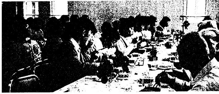
つくしの会 会食風景