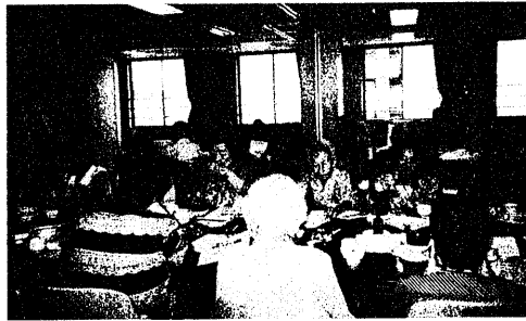
アップルの会 会食風景

大砂土東地区社会福祉協議会では、六十五歳以上の一人暮らしのお年寄りを対象に、ふれあい会食サークルをボランティアグループのご協力で実施しています。月一回、二つの会場で行われています。一つは「つくしの会」によるもので、毎月第三月曜日、大砂土東公民館が会場です。おのおお大和田、島、堀崎地区の方を対象にしています。もう一つは「アップルの会」によるもので、毎月第四火曜日、東大宮コミュニティセンターで行っています。東大宮一丁目七丁目の方を主な対象にしています。