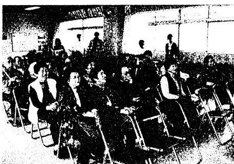
おたっしや劇に場内爆笑