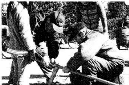
親子竹馬作り教室

二月十七日(日)、親子竹馬作り教室が開かれました。昔ながらの竹と縄を使った竹馬を、子供のごろ作って遊んだという、地域の竹馬作り名人たちのご指導のもとに、二十組の小学生と保護者が、作って楽しんでました。