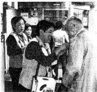
赤い羽根募金活動 大和田駅前